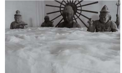
小沢剛 ホワイトアウト - 大宰府・観世音寺 - 2008年

今年の大津祭は10月6日(土)宵宮、10月7日(日)本祭です。ちま吉グッズはJR大津駅から琵琶湖に向かって徒歩5分の左手の特設会場「ちま吉センター」にて販売しています。大学祭と日程が重なっていますが、ちま吉くんがいる湖国三大祭りの大津祭りに是非お越しください。大津祭とちま吉の詳細は「NPO法人大津曳山連盟公式サイト http://www.otsu-matsuri.jp/home/ 」「ちま吉ウェブサイト http://www.chimakichi.com 」をご覧ください。